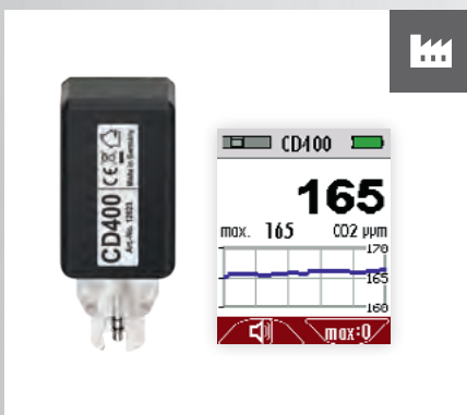
Messung Kohlendioxid in Umgebung* CO 2 -Sensor