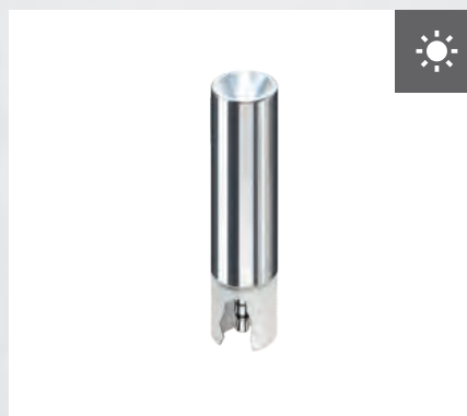
LED-Taschenlampe* 21 Lumen, 5.000 K