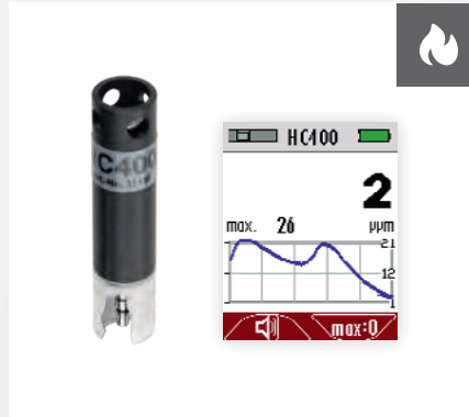
Lecksuche an Gasinstallationen HC-Sensor (Brennbare Gase)