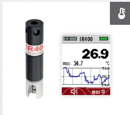
Berührungslose Temperaturmessung* IR-Sensor (Oberflächentemperatur)