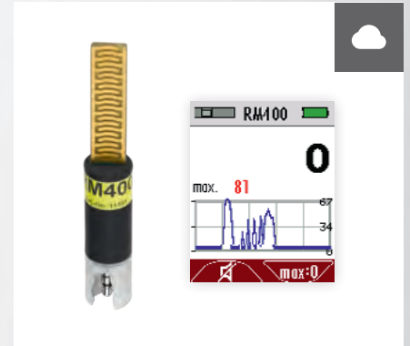
Lecksuche an Abgasanlagen* RM-Sensor (Abgasrückstau)