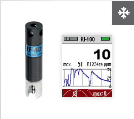
Lecksuche an Klimageräten RF-Sensor (Kältemittel)