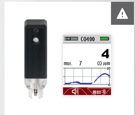
Messung Kohlenmonoxid in Umgebung* CO-Sensor